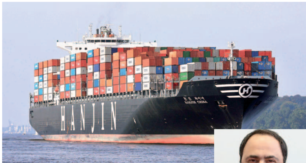
Κινητικότητα αγορών και στα containerships, στα οποία ξεχώρισε μία μεγάλη αγορά του εφοπλιστή Βαγγέλη Μαρινάκη.

Στα containerships η αγορά του κ. Μαρινάκη θεωρείται σημαντική ευκαιρία. Ειδικότερα η ναυτιλιακή εταιρεία Capital Ship Management του Έλληνα εφοπλιστή πρόσφερε 150-160 εκατ. δολ. για την απόκτηση πέντε πλοίων μεταφοράς εμπορευματοκιβωτίων που ανήκαν στην πτωχευμένη κορεατική ναυτιλιακή